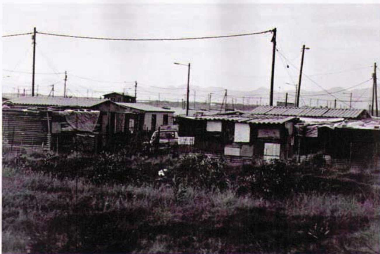
Soweto, Johannesburg , il ghetto simbolo della discriminazione razziale

more, sistemi d'allarme per un immediato pronto intervento delle agenzie di sicurezza private che promettono, come da pubblicità, di arrivare entro tre minuti.