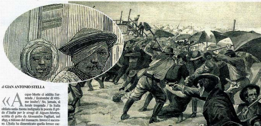
Dalla rivista «L'Illustrazione Italiana»: qui accanto, la prima aggressione nelle saline; a sinistra, operai italiani feriti

Memoria Un libro sull'eccidio compiuto nel 1893 contro i nostri connazionali che ceccavano lavoro nelle saline francesi della Camargue